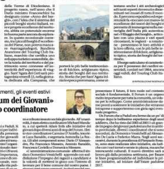
Sant'Agata dei Goti, borgo di 1.500 abitanti, è stato scelto per rappresentare il Sannio nella manifestazione.

Sant'Agata dei Goti, borgo di 1.500 abitanti, è stato scelto per rappresentare il Sannio nella manifestazione «Borghi più belli» che si svolgerà a Roma dal 12 al 19 giugno. Il borgo, situato a 1.200 metri di quota, è stato scelto per la sua storia e per la sua gastronomia. La manifestazione, organizzata dal Ministero del Turismo e dal Touring Club Italiano, ha l'obiettivo di valorizzare i borghi italiani e di far conoscere la loro storia e la loro gastronomia. Il borgo di Sant'Agata dei Goti, con i suoi 1.500 abitanti, è stato scelto per rappresentare il Sannio nella manifestazione. Il borgo, situato a 1.200 metri di quota, è stato scelto per la sua storia e per la sua gastronomia.