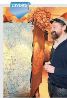
«Lionardo's Senses» ad Anchiano Una mostra multisensoriale

DAL 19 AL 21 MAGGIO, in occasione del Festival "In/Canti e Banchi", è stato indetto un concorso floreale. I partecipanti dovranno abbinare con composizioni floreali, appunni, i temi e i lavori delle case del centro storico di Castelfiorentino, per aggiudicarsi i premi messi in palio dal Comune. Per partecipare al concorso è sufficiente compilare il modulo di iscrizione e consegnarlo all'Ufficio Relazioni con il Pubblico del Comune entro le 18 di mercoledì 17. Gli abbinamenti floreali invece, dovranno essere pronti entro giovedì 18, data che il giorno seguente un apposita giuria provvederà a visitare gli spazi allestiti. La premiazione si svolgerà durante l'ultimo giorno di festival - domenica 21 - a partire dalle 19 in Piazza del Popolo. Ad essere premiati saranno i abbinamenti più creativi ed originali. Il primo classificato riceverà una cartella con denaro contante, fazzoletti e annulli speciali. Il giorno del Tour del Popolo in occasione del suo 150° anniversario, il secondo classificato, invece, avrà il ruolo dei biglietti gratuiti per uno spettacolo della stagione teatrale 2017/2018 del Teatro del Popolo; per il terzo premio sono stati messi in palio due biglietti d'ingresso al cinema "Mondicelli".